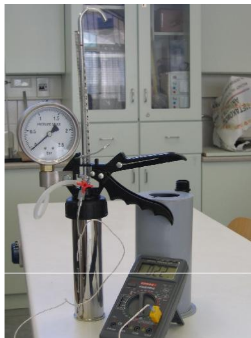
Εικ. 1. Η πειραματική διάταξη

Συνδέουμε τον πλαστικό σωλήνα του μανόμετρου στην κατάλληλη υποδοχή του μεταλλικού θαλάμου. Προσαρμόζουμε τον αισθητήρα θερμοκρασίας στο θάλαμο εισάγοντας το καλώδιο στο σωληνάκι που είναι κολλημένο στην εξωτερική επιφάνεια του κυλινδρικού θαλάμου. Τοποθετούμε το ημισυναρμολογημένο σύστημα μέσα στο υδατόλουτρο προσέχοντας ώστε το καλώδιο του αισθητήρα θέρμανσης να περάσει μέσα από την αντίστοιχη εγκοπή του κολάρου του υδατόλουτρου. Ύστερα βάζουμε την κλίμακα ογκομέτρησης στην ειδική υποδοχή πίσω από το στέλεχος του εμβόλου. Συνδέουμε το άλλο άκρο του αισθητήρα θέρμανσης στην υποδοχή του πολύμετρου με τέτοιο τρόπο ώστε το πλατύ λαμάκι να βρεθεί προς την πλευρά της οθόνης του πολύμετρου. Το αέριο του οποίου θα μετρήσουμε τα P, V και T είναι απλά ο ατμοσφαιρικός αέρας.