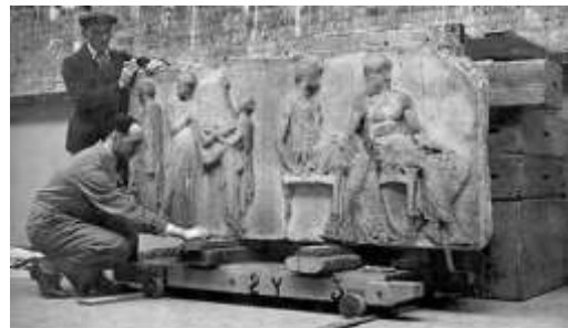
Η ΕΙΚΟΝΑ ΤΗΣ ΚΛΟΠΗΣ

Ωστόσο, τα επιχειρήματα για τη μη επιστροφή των μαρμάρων καταρρίπτονται και ειδικότερα σήμερα. Εκτός του ότι το εμπονομαζόμενο φερμάνι δεν έφερε ποτέ την υπογραφή του Σουλτάνου και άρα καθίσταται παράνομη η μεταφορά, πλέον κανείς δε μπορεί να ισχυριστεί ότι δεν υπάρχει ο κατάλληλος χώρος για την ασφαλή φύλαξη των μνημείων. Το Μουσείο της Ακρόπολης ήδη διαθέτει ειδικά διαμορφωμένους χώρους για τον επαναπατρισμό των μαρμάρων, πράγμα που η Βρετανική Κυβέρνηση «αγνοεί οικειοθελώς». Η Ελλάδα είναι ικανή να προστατέψει την πολιτιστική της κληρονομιά, παρά το ότι βιώνει τις επιπτώσεις της παγκοσμιοποιημένης οικονομικής κρίσης με τη Βρετανία να προσπαθεί με μονοκρατορικό τρόπο να διατηρήσει «τα κέρδη», που της αποφέρουν ετησίως τόσο τα Ελγίνεια όσο και τα υπόλοιπα πολιτιστικά αγαθά άλλων πολιτισμών, που εκθέτει στο Μουσείο της.